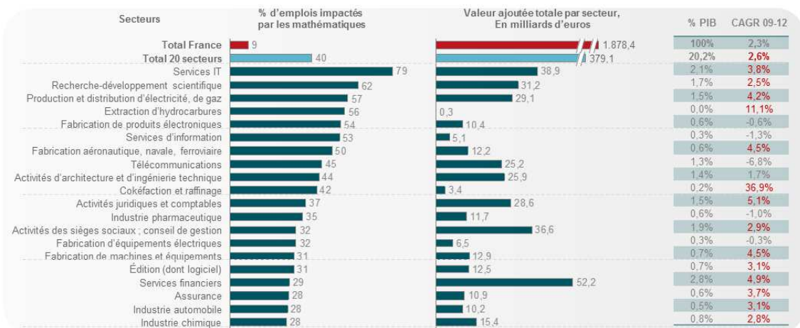
Graphique : Top 20 des secteurs les plus impactés par les mathématiques en termes d'emplois (2012)

Plus spécifiquement, 15 des 20 secteurs les plus contributeurs ont une croissance significativement supérieure à celle du PIB. Cela concerne notamment les Services IT, l'énergie (électricité, hydrocarbures etc.), l'industrie (automobile, aéronautique, ferroviaire etc.), la banque, finance et assurance.